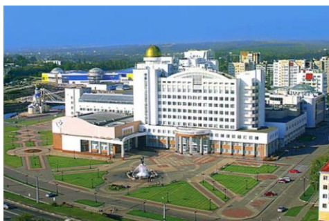
Белгородский национальный университет